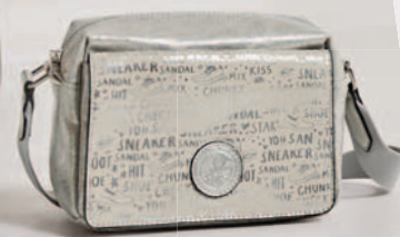
H1455-90 € 39.95