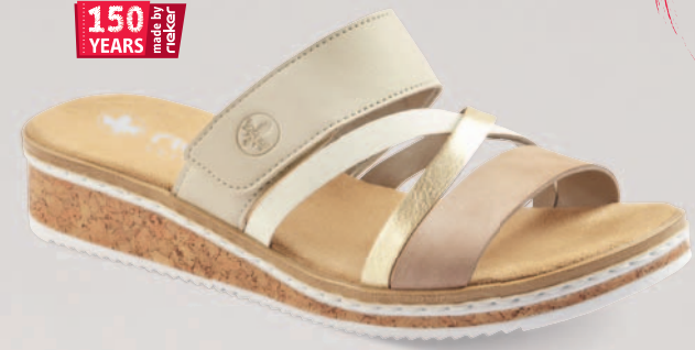
V3652-94 € 49.95 150 YEARS made by rieker