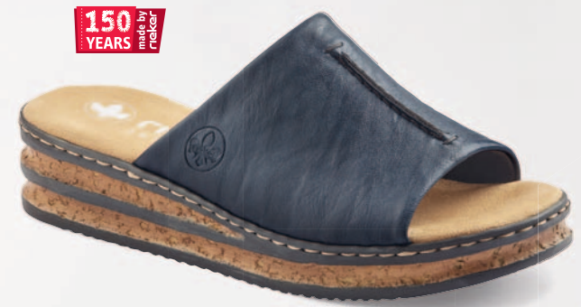
62905-14 € 49.95 150 YEARS made by rieker