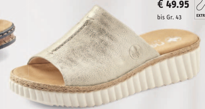
69288-60 € 49.95 bis Gr. 43