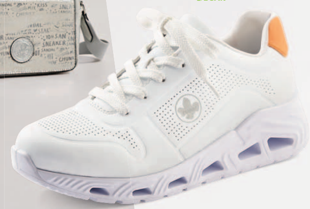
N5202-80 € 64.95 bis Gr. 43 lose Einlage Innensohle „Soft“ VEGAN