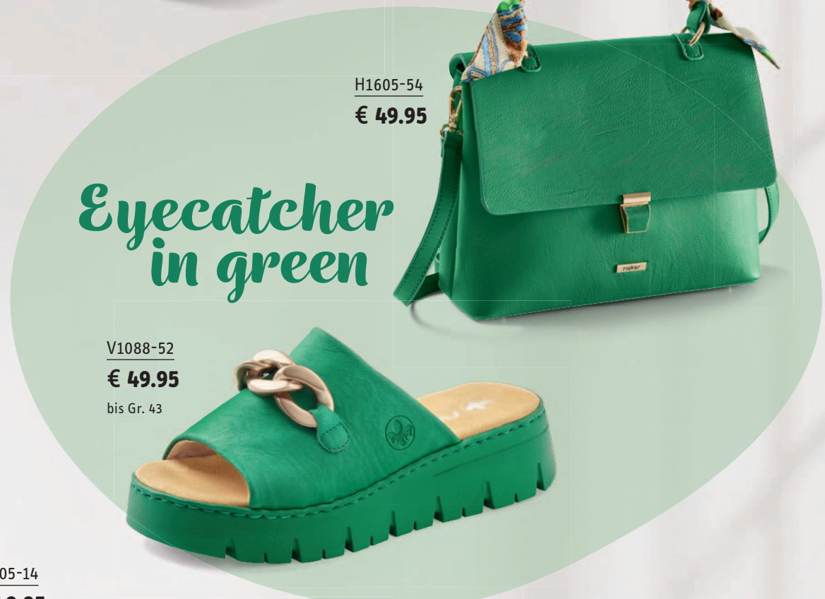
H1605-54 € 49.95