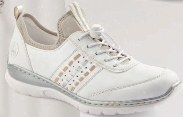
L3259-80 € 69.95 MemoSoft 150 YEARS made by rieker