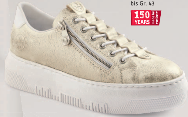
M1953-60 € 64.95 bis Gr. 43 150 YEARS made by rieker